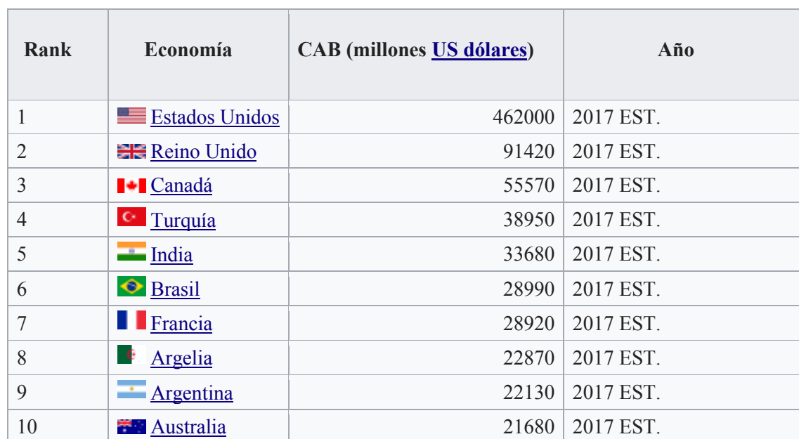
Cuadro 1 Diez de los 20 países con el mayor déficit comercial en el mundo

Aunque es cierto que en los últimos años los Estados Unidos han experimentado un déficit comercial con México, éste es significativamente menor al que mantiene con China.