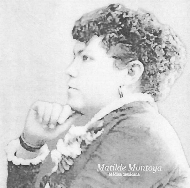
Matilde Montoya Médica mexicana