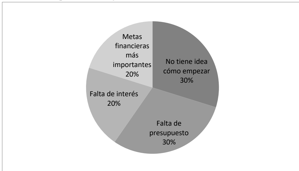
Gráfico 2. Por qué no se trabaja en RSE